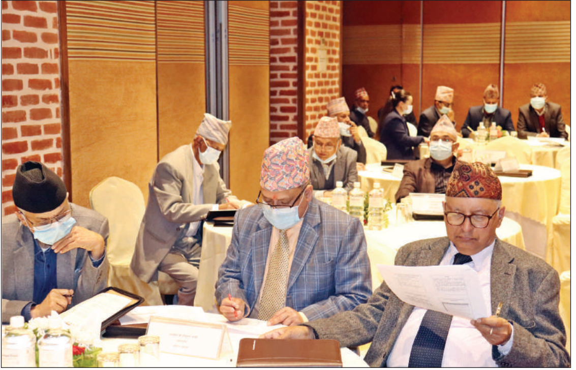
न्याय परिषदका पदाधिकारी एवं सर्वोच्च अदालतका न्यायाधीशहरूबीच आयोजित अन्तर्क्रिया कार्यक्रममा सहभागी हुनुहुँदै सर्वोच्च अदालतका माननीय न्यायाधीशज्यूहरू ।