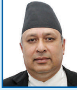
सम्माननीय अध्यक्ष श्री हरिकृष्ण कार्की